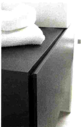
BOMA Imago Design

Disegnata da Imago Design e prodotta dall'azienda friulana Rexa Design, la collezione Boma di arredi e sanitari per il bagno utilizza i laminati Abet, selezionati per le ottime prestazioni funzionali ed estetiche. Resistente all'acqua, al graffio e all'usura, antibatterico e facile da pulire, il laminato è ideale per l'ambiente bagno. Nella foto: dettaglio dell'anta di un arredo della serie in stratificato fenolico nero climb con spessore interno in tinta.